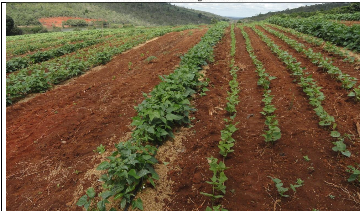
Área de plantio de feijão, junto à linha de cafeeiros (plantas maiores de feijão), mais um plantio intercalar adicional, nas ruas, este com feijoeiros menores, em Bonito-BA.